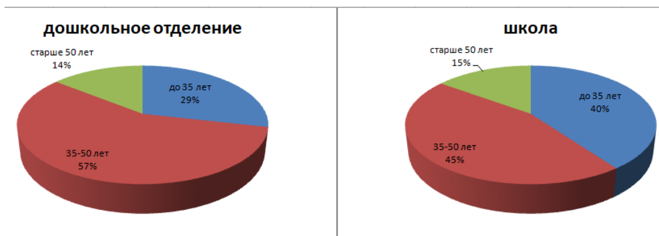
Рис. 2. Распределение педагогов МБОУ «Кобраловская ООШ» по возрастным группам

Средний возраст педагогов в коллективе составляет 40 лет, распределение по возрастным группам в долевом отношении представлено на рисунке 2.